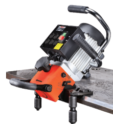
Úhlové zkosení desek