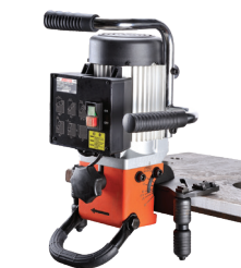
Rovné zkosení desek 0°