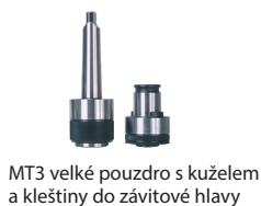
MT3 velké pouzdro s kuzelem a kleštiny do závitové hlavy