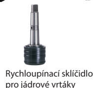
Rychloupínací sklíčidlo pro jádrové vrtáky