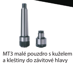
MT3 malé pouzdro s kuzelem a kleštiny do závitové hlavy